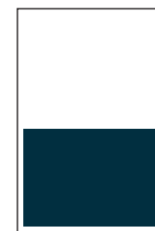
1/2 Seite quer S: 184 x 132 mm