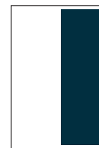
1/2 Seite hoch S: 90 x 269 mm