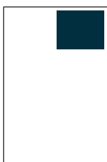
1/8 Seite S: 90 x 64 mm

Formatangaben Alle Anzeigenformate sind in Breite x Höhe angegeben